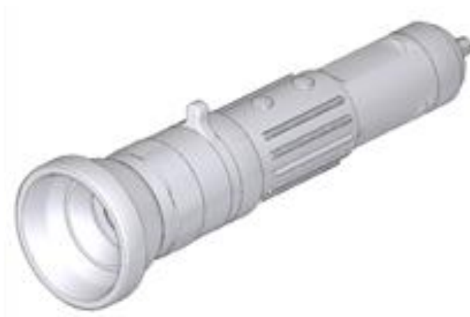
Kamera do badań ogólnych

Przed rozpoczęciem sprawdź, czy wszystkie poniższe elementy zostały dołączone do produktu. Jeśli czegoś brakuje, skontaktuj się ze sprzedawcą.